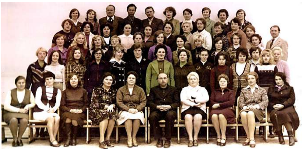
5 гадоў сярэдняй школе № 10

Я ўдзячна лёсу, што звязаў мяне з Маладзечнам, з гімназіяй № 10!